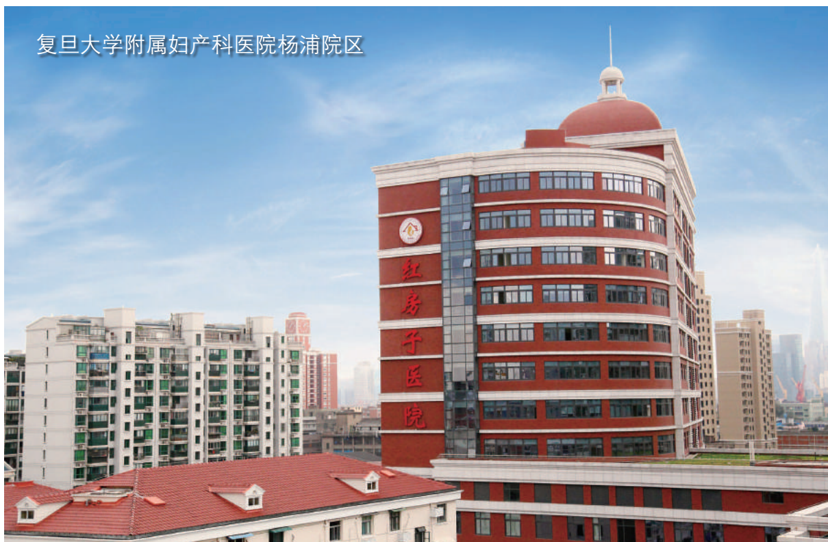
复旦大学附属妇产科医院杨浦院区