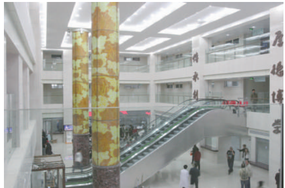
芷江路总院门诊大厅