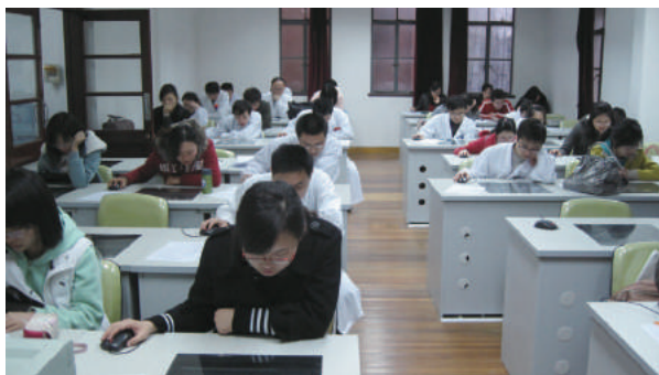
住院医师参加理论出科考试

国住院医师培训精英教学医院联盟成员（上海唯一一家），是上海市卫生计生委首推的对外省来沪参观学习住院医师规范化培训经验最主要的医院。医院自 2004 年成为上海市首批全科医师规范化培训临床基地，已培养合格全科医师 268 名。医院共有卫生部及上海市卫生局审核批准的住院医师 / 专科医师规范化培训基地 43 个，包括内科、外科、妇产科、神经内科、麻醉科、全科、检验科、急诊科、影像医学科、病理科、口腔科、皮肤科、眼科、耳鼻喉科和中医科共 15 个住院医师规范化培训基地和心内科、呼吸科、消化科、血液科、风湿科、肾病科、内分泌科、普外科、整形外科、骨科、泌尿外科、心外科、胸外科、麻醉科、老年科、肿瘤内科、肿瘤外科、肿瘤放疗科、病理科、超声诊断科、放射医学科、核医学科、急诊科、检验科、口腔科、皮肤科、