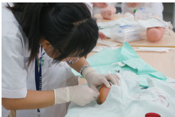
住院医师技能操作培训