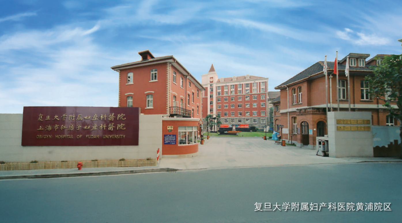
复旦大学附属妇产科医院黄浦院区